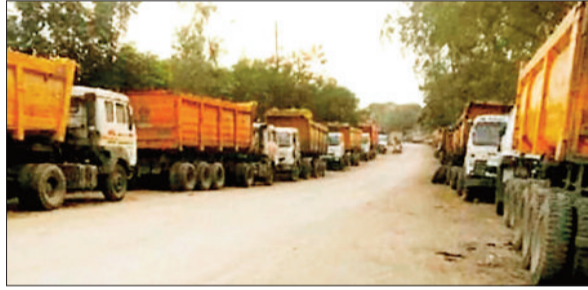
अशोक वाटिका के दोनों ओर खड़े भारी वाहन।

होते ही उद्यान में हरेभरे पेड़-पौधे, रंग-बिरंगी लाइटें, फौवारे के बीच ठंडकता का लुफ्त उठाने के लिए बड़ी संख्या में लोग पहुंच रहे हैं लेकिन उद्यान के पास भारी वाहनों की बेतरतीब से लोग परेशान हैं। मार्ग पर भारी वाहनों की लंबी कतार लगी रहती है। कई बार सड़क के दोनों ओर दो कतार में भारी वाहनों का रेलमेलप लगा रहता है। मार्ग पर कई जगह पर्याप्त लाइट की सुविधा नहीं है। इससे हादसे की आशंका बनी रहती है। इसके बाद भी समस्या को लेकर गंभीरता नहीं दिखाई जा रही है। इस कारण कई लोग मार्ग में अव्यवस्था की वजह से उद्यान आने से बच रहे हैं।