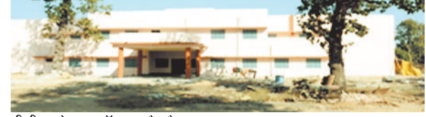
पीजी कॉलेज का हॉस्टल और मैदान।

महाविद्यालय खेल प्रतियोगिताओं को लेकर पीजी कॉलेज की एक अपनी पहचान है। विश्वविद्यालय खेल कैलेंडर के अनुसार यहां महाविद्यालयीन स्तर की प्रतियोगिताएं आयोजित की जाती हैं। जिले का सबसे बड़ा कॉलेज होने के कारण खेल गतिविधियों को बढ़ावा देने हेतु महाविद्यालय के पीछे इनडोर बैडमिंटन कोर्ट का निर्माण डीएमएफ मद से किया गया था। निर्माण में एक बड़ी राशि खर्च होने