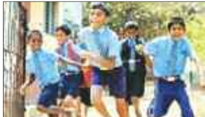
को स्कूल आना पड़ेगा।

प्रदेश में पड़ रही तेज गर्मी के मद्देनजर राज्य शासन ने सभी शासकीय अशासकीय स्कूलों में ग्रीष्मकालीन अवकाश 22 अप्रैल से घोषित कर दिया है। अब स्कूल 15 जून को ही खुलेंगे। पिछले कुछ दिनों से तेज गर्मी के कारण अभिभावकों की मांग थी कि स्कूलों में अवकाश घोषित किया जाए। वहीं जिला प्रशासन ने भी स्कूलों के अवकाश को लेकर अपनी रिपोर्ट शासन को भेजी थी। शासन के आदेश से 22 अप्रैल से सभी स्कूलों में अवकाश घोषित कर दिया है, किंतु शिक्षकों