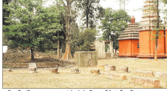
सर्वेश्वरी मंदिर का उद्यान जहां बैठने के लिए कुर्सियां भी नहीं।

दर्रा बांध के समीप प्रगतिनगर क्षेत्र में बनाया गया सर्वेश्वरी मंदिर उद्यान अब उजड़ गया है। न तो यहां बिजली की व्यवस्था है और ना ही पानी की। सुविधाओं की दृष्टि से मंदिर और सर्वेश्वरी उद्यान में बनी हुई है। टूटी कुर्सी और टूटे झूले अब इस उद्यान की पहचान बनती जा रही है। एक बड़ी राशि खर्च कर उद्यान को नया स्वरूप दिया गया था। आज वह उस स्वरूप को तसरा रहा है। शहर के अलावा उपनगरीय क्षेत्रों में भी शाम के समय आमजनों के लिए घूमने के लिए कोई बड़े गार्डन नहीं दिखाई पड़ रहे हैं। एनटीपीसी के सिल्वर जूबिली पार्क के अलावा अन्य किसी स्थान में ऐसे कोई गार्डन नहीं दिख रहे हैं। दर्रा प्रगतिनगर