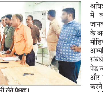
निरीक्षण के दौरान अधिकारियों से जानकारी लेते प्रेक्षक।

तालाबों की सफाई से लेकर सौंदर्यीकरण तक की बागडोर संभालने के लिए युवा आगे आ रहे हैं। बिना सरकारी सहयोग से युवा अब श्रमदान करके अपने क्षेत्र की तस्वीर बदल रहे हैं। ऐसा ही एक नजारा वार्ड क्रमांक 29 में देखने को मिला, जहां वार्ड के युवाओं की टोली ने वार्ड में स्थित तालाब का काया पलट कर दिया। कभी तालाब जन जीवन का एक जरूरी हिस्सा हुआ करता था, पीने के पानी को जरूरतों को पूरा करने के साथ-साथ वे उनके सामाजिक ताने-बाने से भी जुड़े थे। धार्मिक और पेयजल दोनों उद्देश्यों के लिए उनका सम्मान किया जाता था और उन्हें बनाए रखने की हरसंभव कोशिश थी। लेकिन जैसे-जैसे हैंडपंप और पाइप से