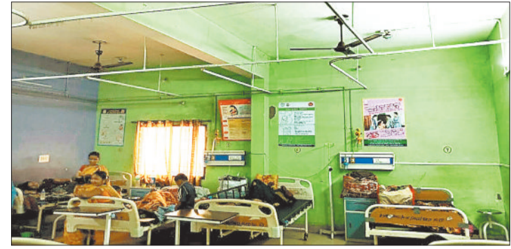
सीएचसी अस्पताल का वार्ड जहां दाखिल हैं मरीज।

पाली का स्वास्थ्य केंद्र जरूरी दवाइयों व चिकित्सकों के अभाव में सिर्फ टीकाकरण केंद्र और गरीब गर्भवती महिलाओं का प्रसव कराने का माध्यम मात्र बन कर रह गया है। वर्तमान भीषण गर्मी पड़ रही है, लेकिन अस्पताल प्रबंधक की उदासीनता से गर्मी में यहाँ भर्ती मरीजों का हाल बेहाल बना हुआ है। मरीज उमस और गर्म हवाओं के थपड़े से जूझ रहे हैं। अस्पताल में पंखे बंद हैं और कूलर चल रहे हैं, लेकिन पानी नहीं होने से मरीजों को ठंडी हवा नहीं मिल रही है। गर्म हवाओं से उन्हें जूझना पड़ रहा है। कंठे पानी के लिए वाटर कूलर तो है,