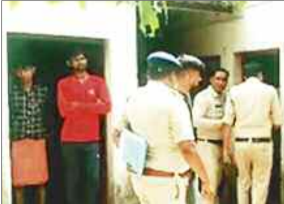
जांव पड़ताल करती पुलिस की टीम।